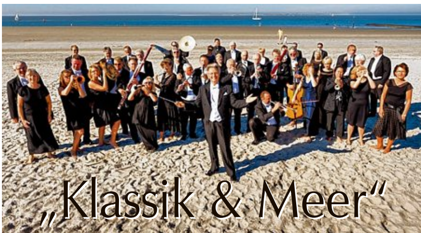
Das Warschauer Symphonie-Orchester sorgt für klassische Musik auf Norderney.

Zum Abschluss sagt ein Südafrikaner am Sonntag, 29. Juli, „Hello Again“ in der Summertime-Arena. Mit Howard Carpendale kommt eine Ikone der deutschen Musikgeschichte nach Norderney.