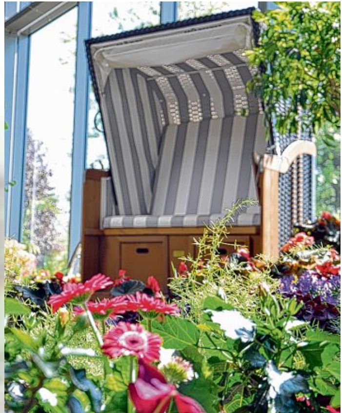
Die Blumenhalle in Wiesmoor ist ein „Blumenmeer“ und zugleich Veranstaltungsort mit vielen attraktiven Angeboten.

Das „Blumenmeer“ in Wiesmoor ist zu jeder Jahreszeit ein Erlebnis.