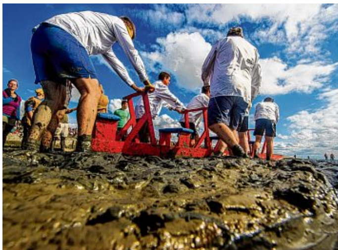
Das Schlickschlittenrennen ist der Höhepunkt der „Wattolümpiade“ in Upleward am 18. August.

UPLEWARD - Nur einmal im Jahr werden in Upleward die Schlitten ins Watt gelassen – mitten im Sommer findet das Schlickschlittenrennen „Wältmeisterschaft & Ostfriesische Wattspiele“ statt – am 18. August. Diesen Termin haben sich die Fans der „größten Schlammschlacht“ im Uplewarder Watt schon lange vorgenommen. Hier werden mit den Schlickschlitten, mit denen früher die Fischer zu ihren Reusen über das Watt glitten, um ihre Reusen zu leeren, abgesteckte Strecken gefahren, Aufgaben gelöst und sogar noch eine kleine Partie Fußball im Watt gespielt. Wie schon in den letzten Jahren gibt es auch in 2018 eine Zusammenarbeit mit der Wattolümpiade (schreibt sich tatsächlich mit „ü“) in Bruns-