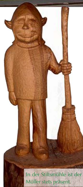
In der Stiftsmühle ist der Müller stets präsent.

Im alten Müllerhaus befindet sich die „Kluntje Teestube“. Zu Tee und Kaffee gibt es selbstgebackenen Kuchen sowie diverse kalte Getränke.