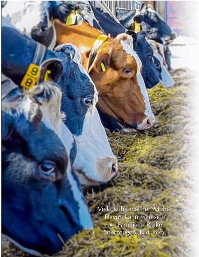
Viele Kühe machen Mühe. Davon kann man sich bei Familie te Brake überzeugen.

SÜDBROOKMERLAND - Wer einen Blick hinter die Kulissen eines Milchviehbetriebes werfen möchte, ist auf dem Bauernhof der Familie te Brake, Punger Weg 4 in Uthwerdum, genau richtig. Wilma und Arend-Jan te Brake öffnen im Juli und August jeweils mittwochs 14 bis 17 Uhr die Stalltüren für einen erlebnisreichen Nachmittag. Nach der Begrüßung und einer Führung über das Hofgelände gibt es Ostfriesentee mit Rosinenbrot. Danach dürfen kleine und große Besucher die Kühe in den Stall holen und beim Melken zuschauen. Bei Gruppen ab zehn Personen wird um Anmeldung gebeten. Telefon: 04942/7 18.