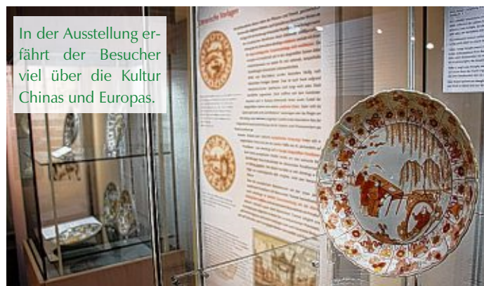
In der Ausstellung erfährt der Besucher viel über die Kultur Chinas und Europas.

„Milch und Blut“ ist pure Poesie von Flora und Fauna des alten China. Hier taucht man ein und lernt die Handelsgeschichte und Handwerkskunst aus einem ganz besonderen Blickwinkel kennen. Zur Ausstellung ist auch ein Katalog erhältlich.