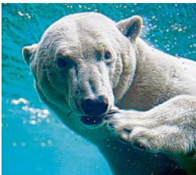
Eisbär „Lloyd“ taucht im Zoo am Meer unter.