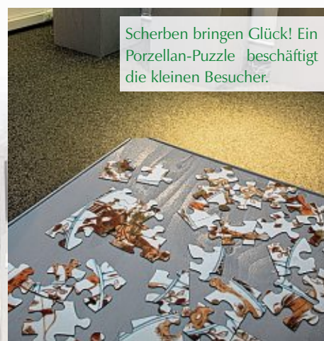
Scherben bringen Glück! Ein Porzellan-Puzzle beschäftigt die kleinen Besucher.