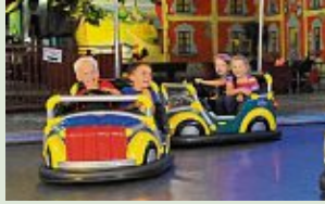
Kinder haben ihren Spaß in der Nordsee-Spielstadt Wangerland in Hohenkirchen.

HOHENKIRCHEN - In der Nordsee-Spielstadt Wangerland schlagen Kinderherzen höher: Auf mehr als 5000 Quadratmeter Fläche erstreckt sich der wetterunabhängige Indoor-Freizeitpark. Zahlreiche Fahrgeschäfte und Attraktionen machen einen Besuch der Spielstadt einmalig. Vom Karussell über ein Riesenrad und Autoscooter bis hin zu einer Indoor-Achterbahn können Kinder hier alles ausprobieren. Bei gutem Wetter lädt zusätzlich ein großer Außenbereich mit zahlreichen Spielgeräten zum Klettern und Toben ein. Im Eintrittspreis sind Pommes, Eis, kalte und warme Getränke inbegriffen. Für Familien, die ihren Urlaub im Dorf Wangerland mit der all-inclusive Verpflegung gebucht haben, ist der Eintritt frei.