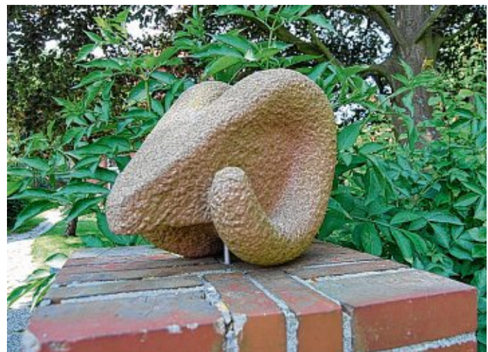
Kunstwerke aus Stein finden die Besucher im Gulfhof Diekskiel.