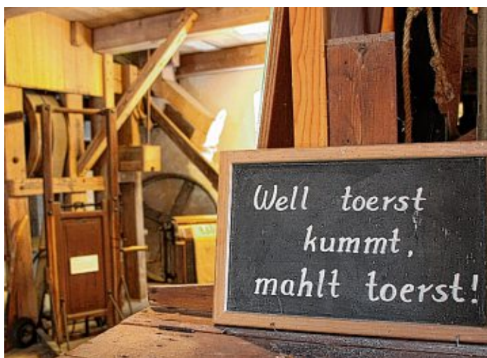
Die Stiftsmühle ist komplett für das Kornmahlen ausgestattet und beherbergt zahlreiche Exponate rund um das Müllerhandwerk und die Mühlentechnik.