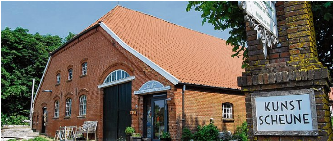
In der Kunstscheune Gulfhof Diekskiel Pilsum haben sich mehrere Künstler niedergelassen.