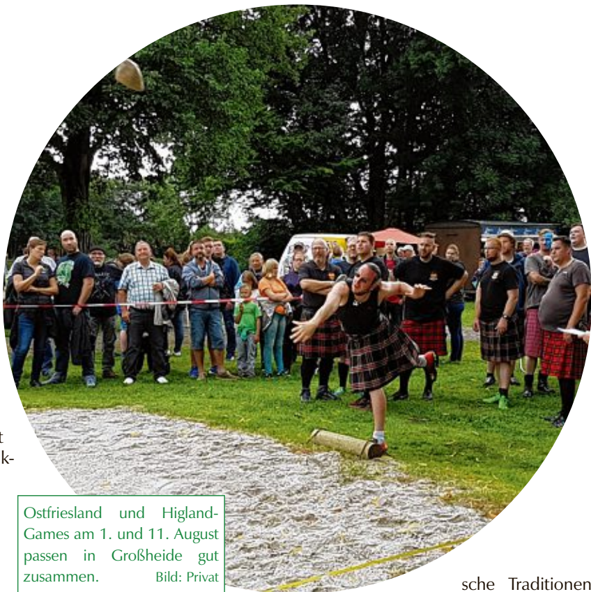
Ostfriesland und Highland-Games am 1. und 11. August passen in Großheide gut zusammen.

Uhr, wird die Veranstaltung mit Live-Musik der Folk-Bands „Vathouse“ und „Tullamore Two“ standesgemäß eingeläutet. Am 11. August ab 10.30 Uhr heißt es dann: „Lasset die Spiele beginnen“. Neben den unterschiedlichen sportlichen Disziplinen, sorgen