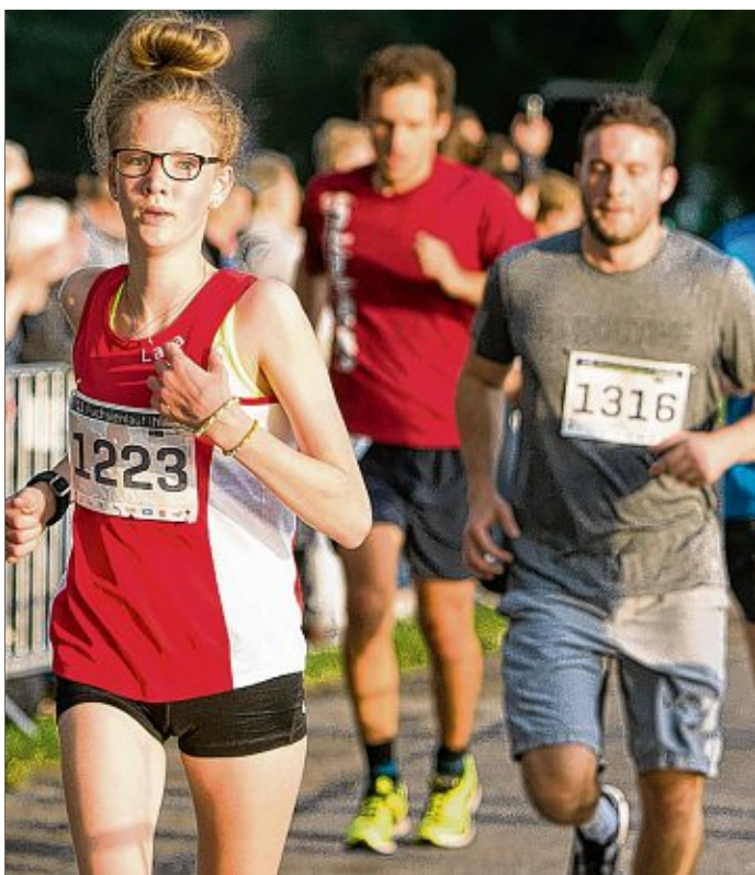
Am Fuchsienlauf können Läufer fast jeden Alters teilnehmen.

17.20 Uhr: 1 km Schülerlauf (Jahrgang 2003 und jünger). 17.40 Uhr: 4 x 1 km Teamstaffeln. 18.10 Uhr: 10 km Volkslauf. 19.40 Uhr: 5 km Volkslauf mit Team-Cup.