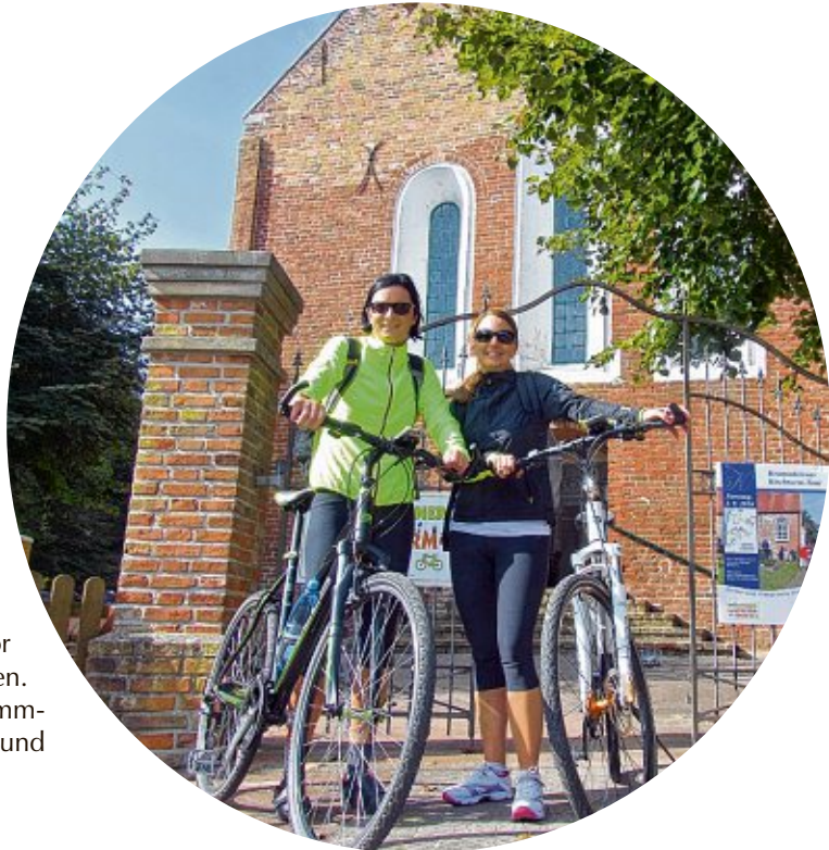
Die 6. Krummhörner Kirchturmtour führt auf idyllischen Wegen zu reizvollen Orten in der Krummhörn.