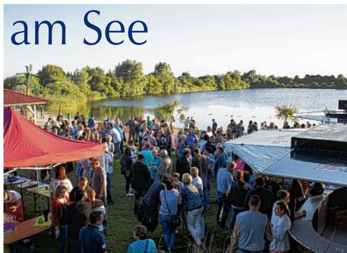
Der Kieselsee in Großheide ist ein beliebter Ort zum Chillen und Grillen bei guter Musik.

zu kurz. Das Kinderfest „Kieselchen“ bietet auch in diesem Jahr wieder ein buntes Rahmenprogramm für seine kleinen Gäste an. Dieses rundet einen Aufenthalt am Kieselsee, rund um den vorhandenen Spielplatz mit dem Schiff „Kieselotte“, gekonnt ab. Das Fest wird am 29. Juli um 14 Uhr eröffnet.