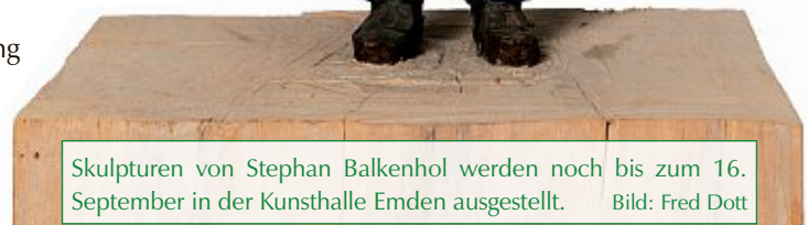
Skulpturen von Stephan Balkenhol werden noch bis zum 16. September in der Kunsthalle Emden ausgestellt.

Ein neues Werk steht nicht weit von Emden, auf der anderen Seite der Grenze: Ende April wurde in Sneek (NL) Balkenhol's „Brunnen von Fortuna“ enthüllt als Teil des Projektes „11 Fountains“ im Rahmen des Kulturhauptstadtjahres 2018 in Leeuwarden.