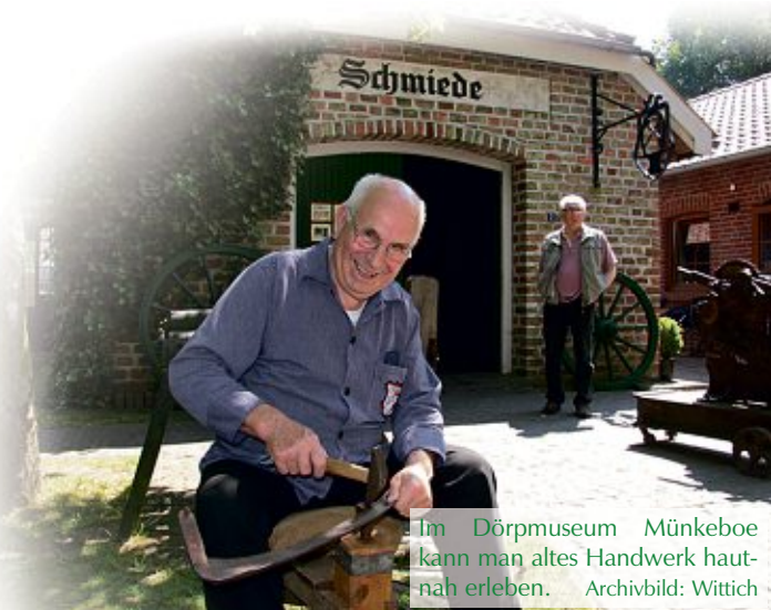
Im Dörpmuseum Münkeboe kann man altes Handwerk hautnah erleben.

Weitere Informationen und Anmeldungen unter 04942 / 2047 2000 und unter www.grossesmeer.de