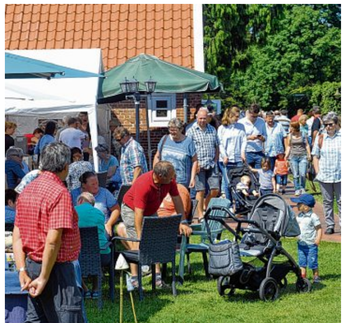
Die Klostertage im Ihlower Forst sind ein Publikumsmagnet.

Auch ein Shuttle-Service mit dem Klostermobil vom Parkplatz zur Klosterstätte und zurück ist eingerichtet. Der Eintritt zur Veranstaltung ist traditionell kostenlos.