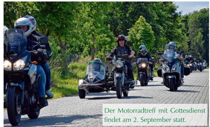
Der Motorradtreff mit Gottesdienst findet am 2. September statt.

Ebenfalls am 2. September beginnt um 17 Uhr im Haus am Meer eine Lesung mit Tini Peters, deren Café, die „Sömmerköken“, in den 80-iger und 90-iger Jahren ein Geheimtipp für Ausflügler war.