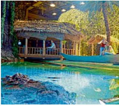
Das Klimahaus Bremerhaven entführt auf eine Reise um die Welt, wie hier nach Samoa.