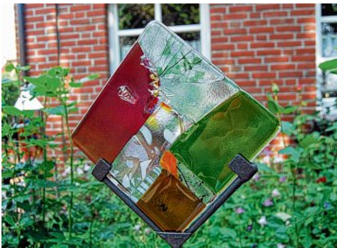
Klaus Happek stellt Kunst-Objekte aus Glas her.

An beiden Tagen wird der Kunstpfad mit einer meditativen Andacht in der Kreuzkirche enden. Am Sonntag soll der Kunstpfad um 11 Uhr mit einer Andacht und einer Taufe beginnen.