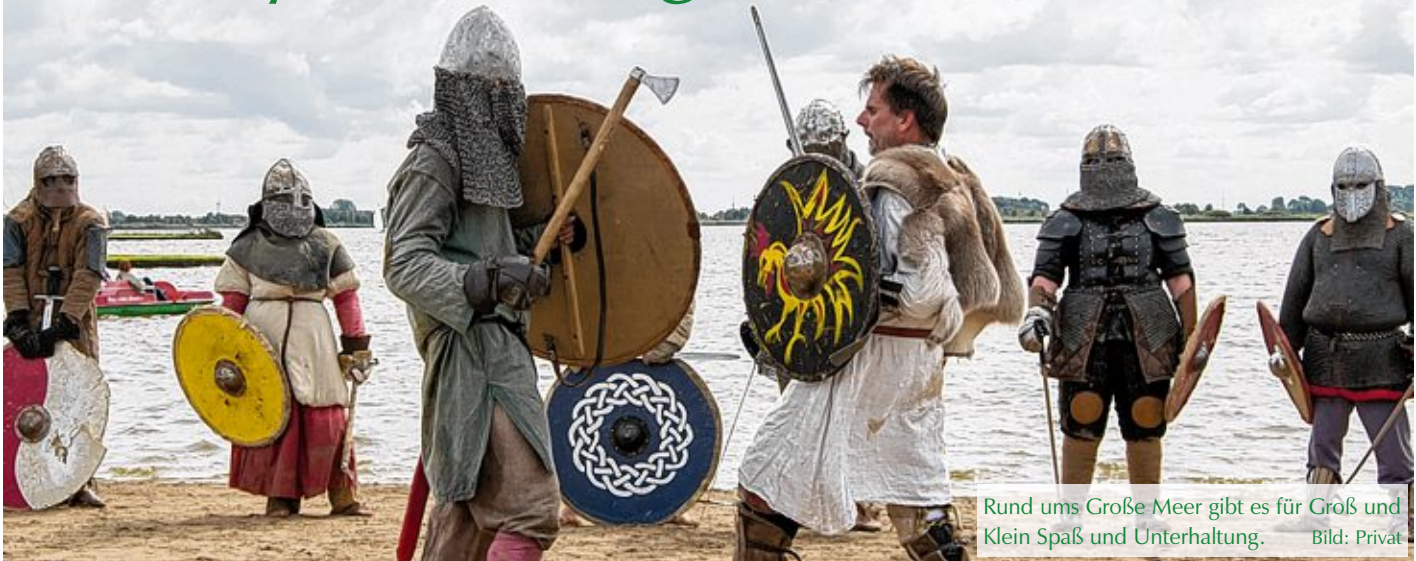
Rund ums Große Meer gibt es für Groß und Klein Spaß und Unterhaltung.