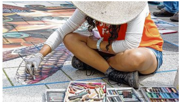
Beim StreetArt-Festival in Wilhelmshaven kann man den Künstlern bei der Arbeit über die Schulter sehen.

Mit viel Herz, Talent und Kreide entstehen bunte Kunstwerke, die ihre Betrachter immer wieder berühren. Fantastische Motive, anrührende Szenen und verblüffend reale Darstellungen ziehen in den Wettbewerb um die Gunst des Publikums und der Jury. Auf drei Arealen werden etwa 30 Bilder entstehen, ein Kinder- und Jugend-Malwettbewerb geboten sowie erneut ein überdimensional großes 3-D-Perspektivenbild kreiert. Im Rahmen des Festivals gibt es ein umfangreiches Rahmenprogramm und die Geschäfte der Innenstadt werden am Sonntag für die Besucher öffnen.