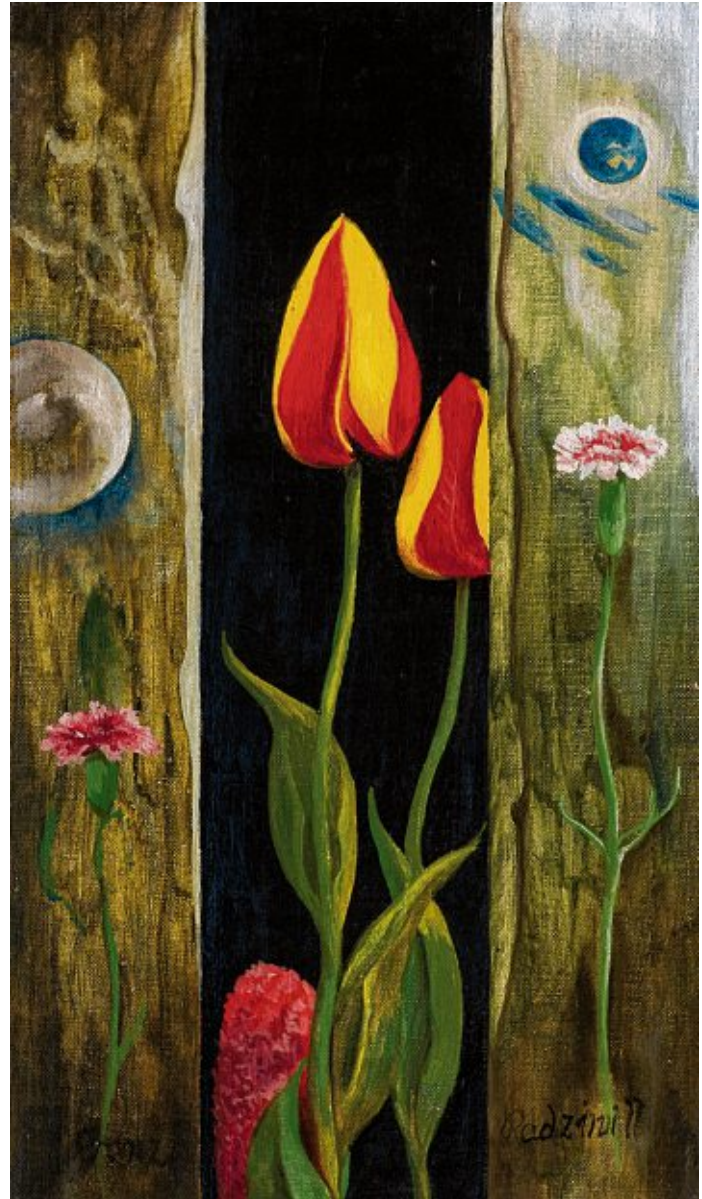
Franz Radziwill malte das Bild „Tulpen und Nelken“ im Jahr 1970. (Slg. Kaufmann, Worspede).

Die aktuelle Ausstellung „Fläche wird Bild“ widmet sich Radziwills Umgang mit der Fläche, denn die Flächigkeit der Leinwand ist der Ausgangspunkt jeder Malerei. Präsentiert werden 20 Ölgemälde aus allen Schaffensphasen. Im Rahmen der Ausstellung findet ein reiches Programm statt und jedem ersten Sonntag im Monat eine öffentliche Besucherführung. Für Kinder wird vom 21. bis 29. Juli ein Theaterprojekt angeboten. Näheres unter www.radziwill.de