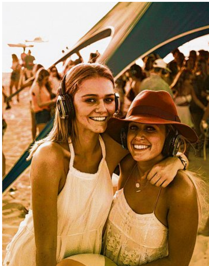
„Zumba, Zumba, Zumba -Täterä!“ – Sport und Feiern in völliger Stille bieten die Babalumba Silent Sounds“ am 21. Juli.

Den Abschluss bildet die eine Party. Jeder Partygast kann zwischen insgesamt drei Kanälen den jeweiligen DJ selbst wählen. Vier DJs sorgen für heißen Sound, jeder auf seinem Kanal. Umgeben von Menschen, die singen und tanzen zur Musik der 90er, zum neuesten Festivalsound