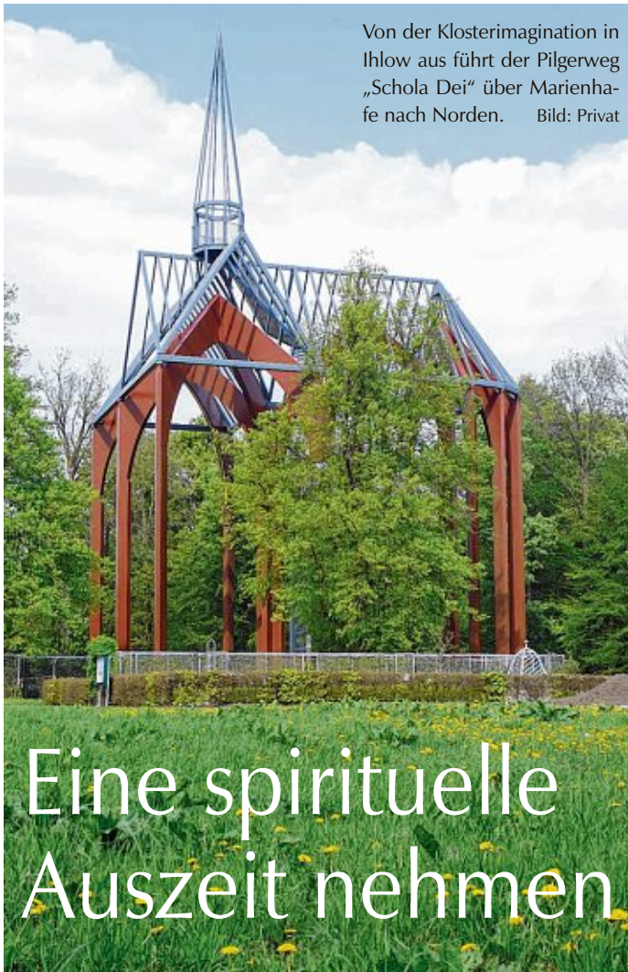
Von der Klosterimagination in Ihlow aus führt der Pilgerweg „Schola Dei“ über Marienhafe nach Norden.