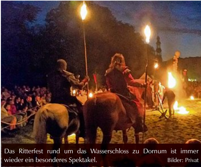
Das Ritterfest rund um das Wasserschloss zu Dornum ist immer wieder ein besonderes Spektakel.

wird in Dornum Einzug halten. Doch für die Besucher gibt es nichts zu befürchten, denn die Häscher durchstöbern den ganzen Markt nach den Kranken, um die Gesunden zu schützen. Zum Abschluss präsentiert sich „das Schloss in Flammen“ mit einer fulminanten Feuershow. Da an beiden Wochenenden verschiedene Künstler und Musiker auftreten, lohnt es sich gleich zwei Mal zu kommen, um nichts zu verpassen.