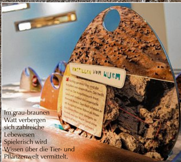
Im grau-braunen Watt verbergen sich zahlreiche Lebewesen. Spielerisch wird Wissen über die Tier- und Pflanzenwelt vermittelt.