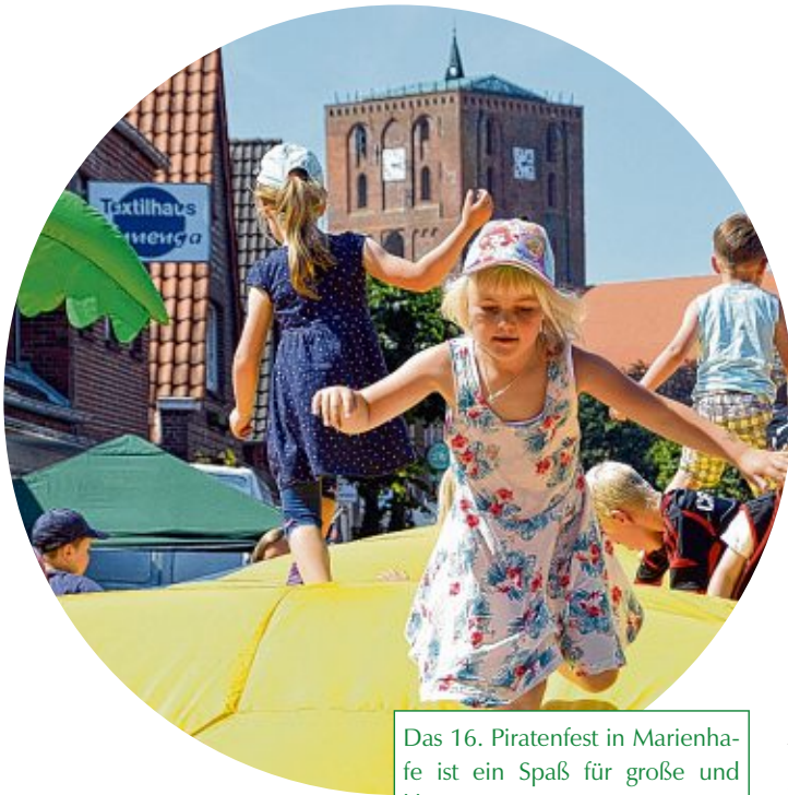
Das 16. Piratenfest in Marienhafte ist ein Spaß für große und kleine Piraten.

MARIENHAFTE - Die Tourist Information Marienhafte und die Interessengemeinschaft der Gewerbetreibenden in Marienhafte laden am Montag, 6. August, von 14 Uhr bis 18 Uhr zum 16. Kinderpiraten-