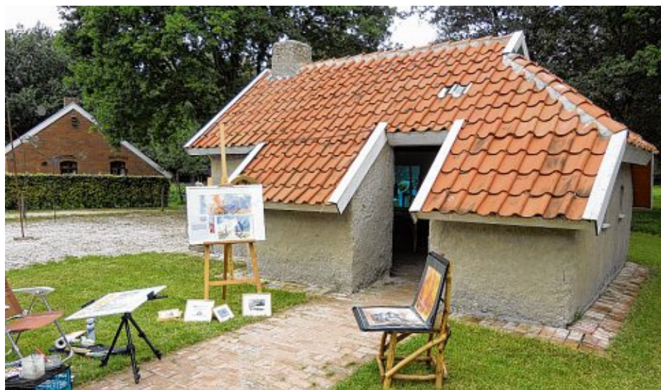
Künstler stellen während der MuseuMenta ihre Werke in Moordorf aus.

MOORDORF - Am Sonnabend und Sonntag, 11. und 12. August, findet wieder die MuseuMenta im Moormuseum Moordorf statt. Von 10 bis 18 Uhr präsentieren Künstler ihre Werke und lassen sich bei der Arbeit über die Schulter schauen. Drumherum gibt es auch Leckeres vom Grill und frische Getränke. Das Originelle: Die Künstler beziehen dazu die zahlreichen Hütten und Katen im Moormuseum und erfüllen sie so mit künstlerischem Leben. Drumherum gibt es immer etwas zu sehen und zu erleben.