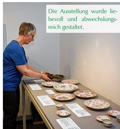
Die Ausstellung wurde liebevoll und abwechslungsreich gestaltet.