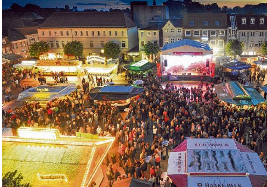
Die Megafete im ostfriesischen Sommer ist nach wie vor das Auricher Stadtfest.

Das große Stadtfest am 17. und 18. August zieht viele Besucher an