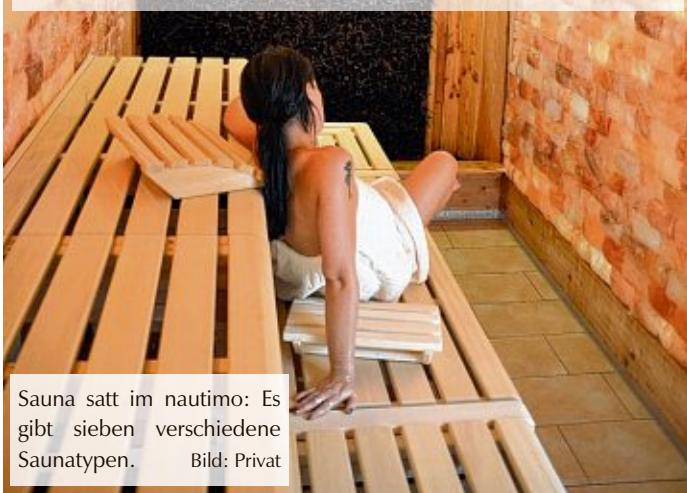
Sauna satt im nautimo: Es gibt sieben verschiedene Saunatypen.

WILHELMSHAVEN - Vier Wasserbereiche mit Sportbecken, Kinder- und Erlebnisbecken, eine Sprunganlage, zwei Röhren-Wasserrutschen, sieben Saunatypen, zahlreiche Spa-Angebote und unzählige Liegeplätze zum Entspannen im Innen- und Außenbereich. So lautet die Kurzbeschreibung der Vielfalt, die alle Was-