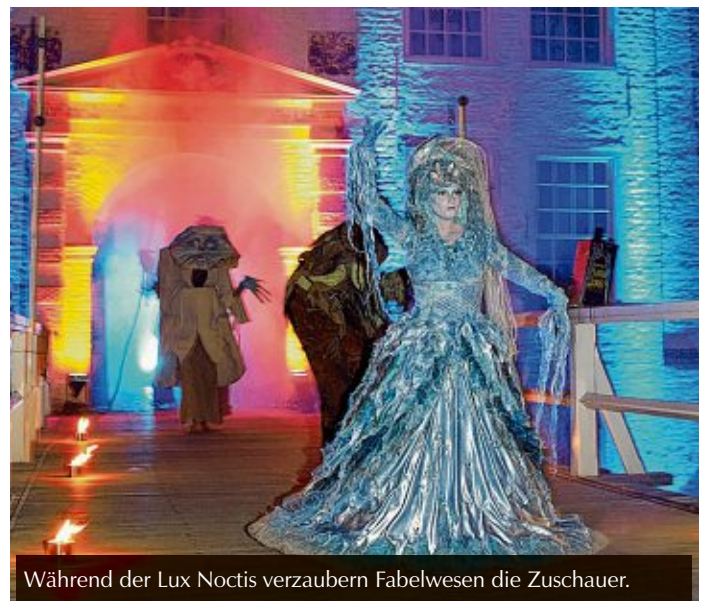
Während der Lux Noctis verzaubern Fabelwesen die Zuschauer.

Am Abend zeigt sich die dunkle Seite des Mittelalters – die Pest