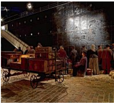
Auf Zeitreise durch 300 Jahre Aus- und Einwanderungsgeschichte im Deutschen Auswandererhaus.

Öffnungszeiten: April bis August: Montag bis Freitag: 9 bis 19 Uhr, Sonnabend und Sonntag sowie feiertags: 10 bis 19 Uhr. September bis März: täglich 10 bis 18 Uhr.