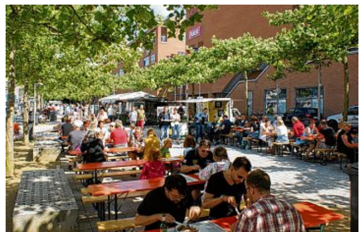
Das weltgrößte Labskaus-Essen findet am 14. Juli in Wilhelmshaven statt.

kaus-Ordens vorgenommen. Außerdem wird die Anzahl der verkauften Portionen Labskaus bekannt gegeben. Organisiert wird das Labskaus-Essen von der Wilhelmshaven Touristik & Freizeit GmbH zusammen mit der Deutschen Marine, der Wilhelmshavener Gastronomie dem City-Interessen-Verein und der Nordseepassage.