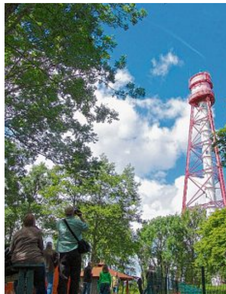
Traum schön und eine echte Herausforderung für Leuchtturmstürmer: der Stahlgerüstturm in Campen.

Der Campener Leuchtturm ist allein schon durch seine Konstruktion und seine Erscheinung ein beeindruckendes Wahrzeichen Ostfrieslands. Der dreibeinige Stahlskelettbau sieht aus wie der kleine Bruder des Pariser Eiffelturms und wurde 1889 fertiggestellt. Für die Fundamente der drei Pfeiler des Turmes und des verkleideten Treppenschachtes wurden vier eiserne Brunnenschlingen durch den Lehm bis auf festen Steinboden getrieben. Auf diese wurde das Fundamentbauwerk gesetzt, das den 300 Tonnen schweren Turm trägt. Denn der muss in seinen Verankerungen