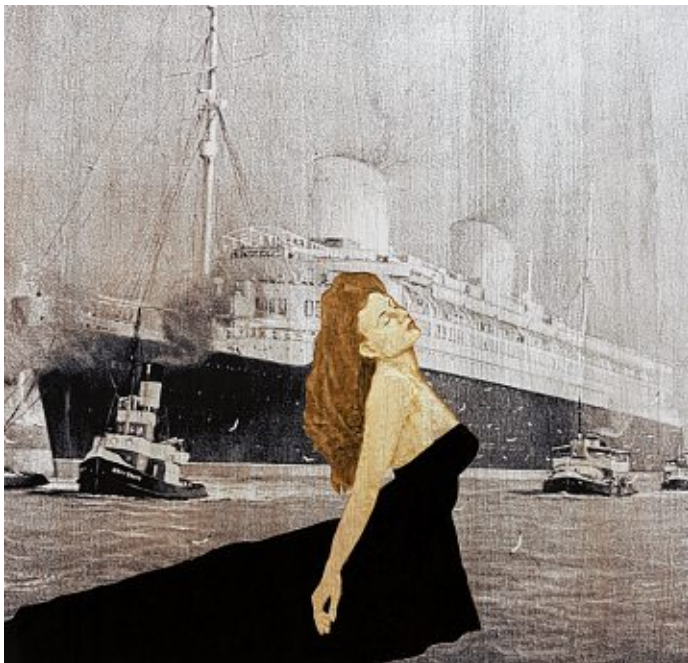
Das Relief Frau im Wasser von Stephan Balkenhol wird ebenfalls ausgestellt.

Ausstellung von Stephan Balkenhol bis 16. September in der Kunsthalle