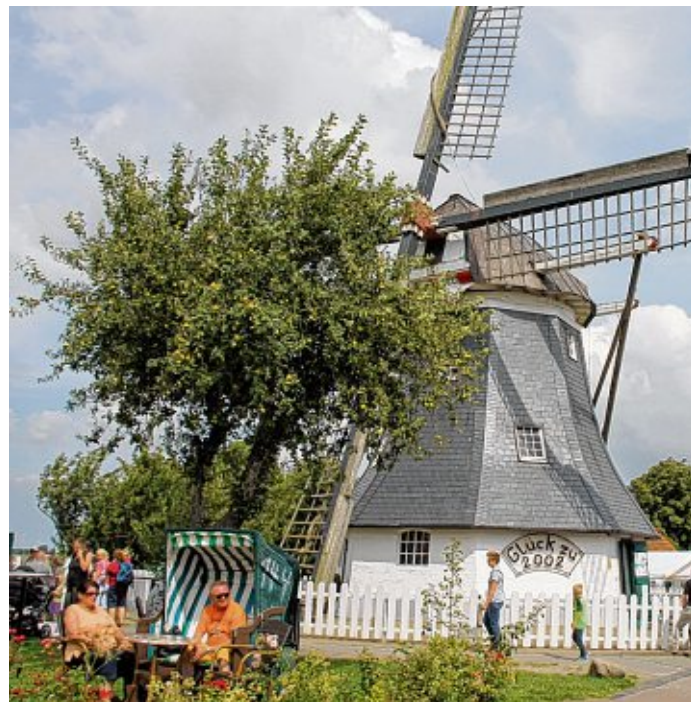
Beim Sommerfest an der Mühle gibt's Musik und Unterhaltung für Jung und Alt.