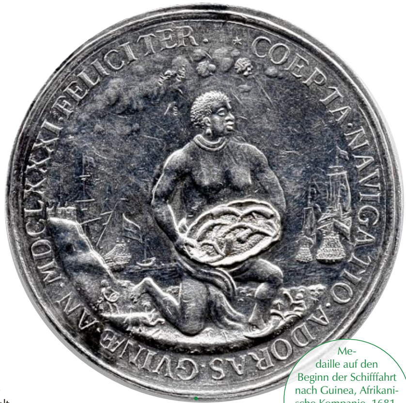
Medaille auf den Beginn der Schifffahrt nach Guinea, Afrikanische Compagnie, 1681, Ostfriesisches Landesmuseum Emden.

„Eala Frya Fresena“ und „Lever dood as Slaav“ sind die historisch überlieferten Wahlsprüche der Ostfriesen. „Lieber tot als Sklave“ – dieses leidenschaftliche, kompromisslose Bekenntnis zur Freiheit ist bis in die heutigen Tage bekannt. Je nach historischem Kontext bedeutet das aber nicht, dass damit immer auch die Freiheit des anderen gemeint ist. So findet sich in der Geschichte Ostfrieslands ein eher unbekanntes, darum aber nicht minder bemerkenswertes Kapitel. Das Theaterprojekt wird gefördert von der Sparkasse Emden und der Ostfriesischen Landschaft.