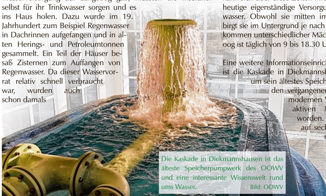
Die Kaskade in Diekmannshausen ist das älteste Speicherpumpwerk des OOWV und eine interessante Wissenswelt rund ums Wasser.

LANGEOOG/DIEKMANNSHAUSEN - Bevor es die zentrale Wasserversorgung auf Langeoog gab, mussten die Insulaner selbst für ihr Trinkwasser sorgen und es ins Haus holen. Dazu wurde im 19. Jahrhundert zum Beispiel Regenwasser in Dachrinnen aufgefangen und in alten Herings- und Petroleumtonnen gesammelt. Ein Teil der Häuser besaß Zisternen zum Auffangen von Regenwasser. Da dieser Wasservorrat relativ schnell verbraucht war, wurden auch schon damals