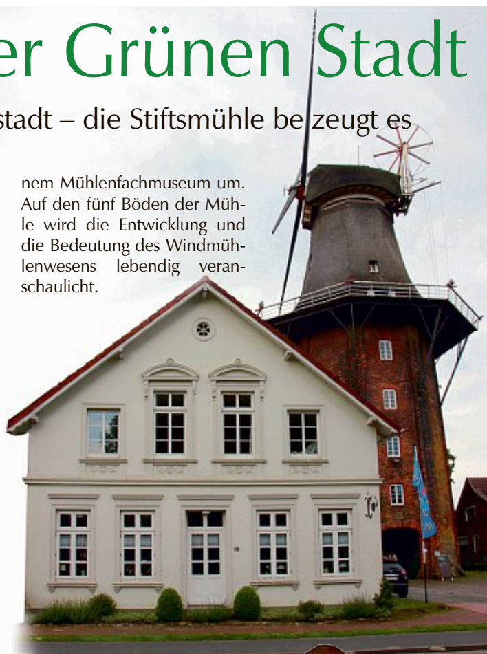
Die Stiftsmühle in Aurich ist ein Wahrzeichen der Stadt.

nem Mühlenfachmuseum um. Auf den fünf Böden der Mühle wird die Entwicklung und die Bedeutung des Windmühlenwesens lebendig veranschaulicht.