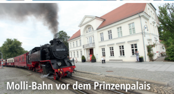
Molli-Bahn vor dem Prinzenpalais